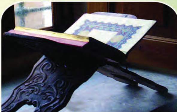
14 القرآن شفاء ورحمة