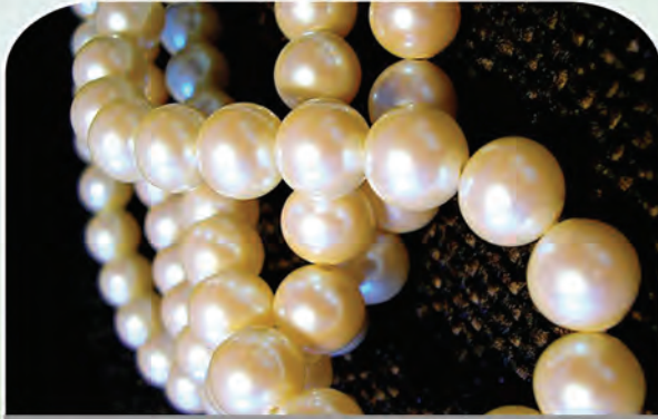
7 الجواهر التي ذكرت في القرآن