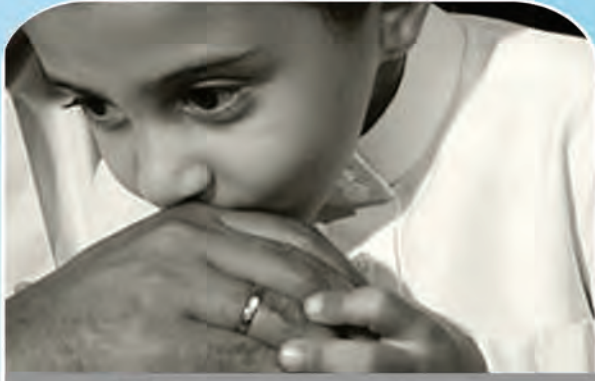
4 حقيقة التذلل للوالدين